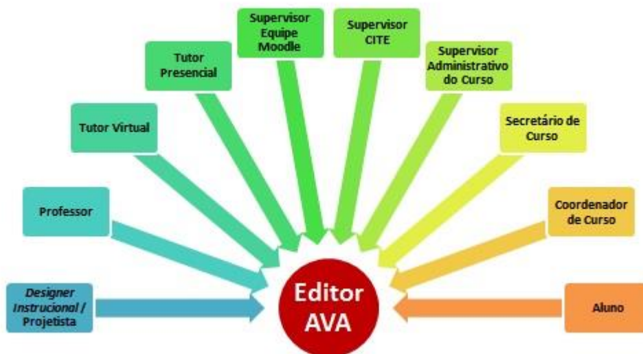
Figura 2. Convergência ao Editor AVA.

Como podemos observar na figura 2, existe uma convergência de solicitações ao Editor AVA, de acordo com as tarefas que ele realiza, e os clientes internos que ele atende.